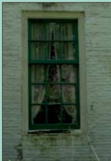
Verf bladdert van de raamkozijnen.