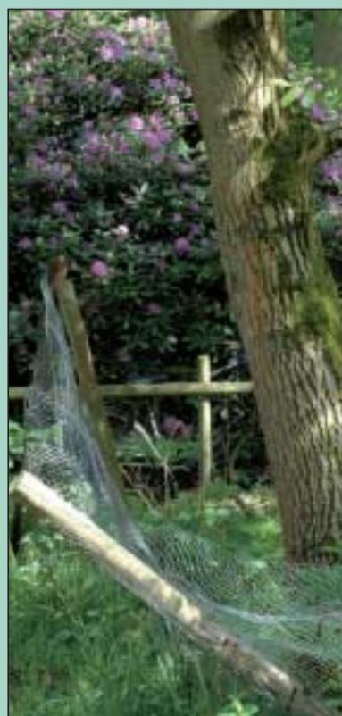
Afscheidingen lijken moedwillig omgetrapt te zijn.