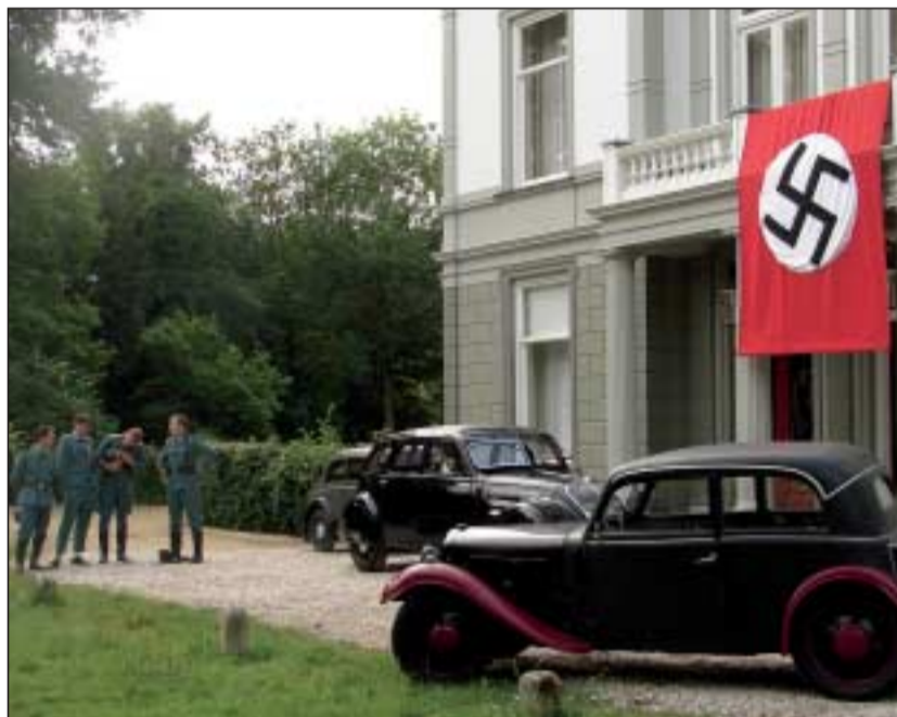
Huiveringwekkende verandering van huis Voordaan.

Dat de aanblik van een pand in oorlogstijd vragen oproept bij nieuwsgierige omstanders, was te verwachten. Maar het productieteam was wel verbaasd over de Lonsdalejongeren, die zaterdagavond op de Groenekanseweg stonden te joelen. Zondagavond werd de sfeer even grimmig: twee auto's stopten ter hoogte van Huis Voordaan en de twee inzittenden schreeuwden 'Heil Hitler' en zwaaiden met een groot mes in de richting van het filmteam. De politie werd direct gealarmeerd en verzekerde de filmmakers en spelers dat ze een oogje in het zeil zouden houden. Voor alle zekerheid werd de nazi-vlag naar binnen gehaald.